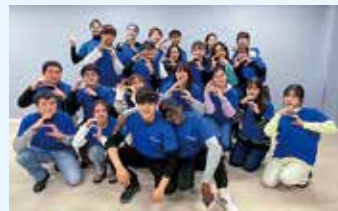
国際交流活動を盛り上げる学生スタッフたち