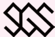
障がい学生サポーターロゴ

SGSは、主に修学における支援にたずさわります。 たとえば、授業において手書きやパソコンによる ノートテイク、車椅子による移動の補助などです。 福井大学に通うすべての学生が、大学での学びの楽しさや人と人とのつながりの大切さを感じるこ とができるキャンパスづくりに取り組んでいます！