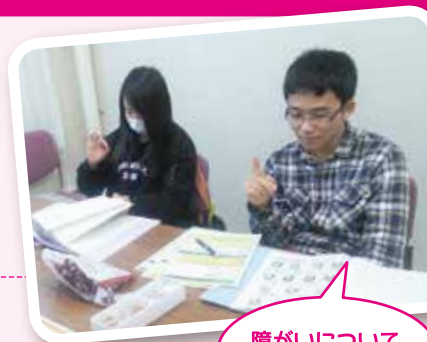
障がいについて 学んだり