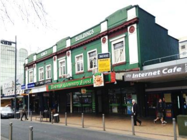
【ハミルトンの街中】