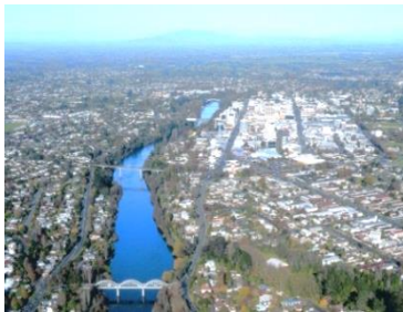
【ハミルトンの街並】

ワイカト・カレッジはワイカト大学のキャンパス内に校舎があるため、図書館をはじめとした様々な大学内の施設を利用でき、金曜の午後には大学のジム内で現地学生と一緒にサッカーやバスケットをすることもできます。英語学習者のための教室は土曜日にも開館しており、大学のメイン図書館も土日にも開館しているので、しっかり勉強したい人におすすめです。