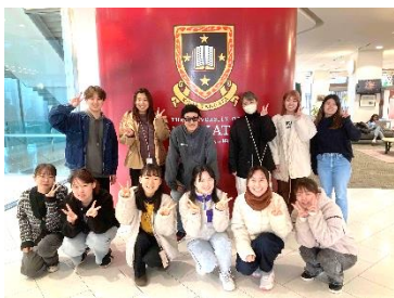
【現地到着時の様子】

原則、参加申込以降のキャンセルは受け付けません。やむを得ない事情により参加をキャンセルする場合、プログラム費、滞在費、往復航空券代等にかかるキャンセル料は各手配先のポリシーマニュアルに基づき参加者の自己負担となります。