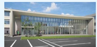
100周年記念施設イメージ

一定額以上のご寄附（個人10万円以上、法人50万円以上）をいただいた場合は、芳名板にご芳名を刻み、末永く顕彰させていただきます。